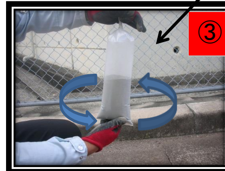
③ ※上部を持ち、袋が風船のようにパンパンになるまでネジります。