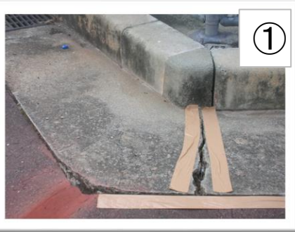
① ガムテープでマスキング。