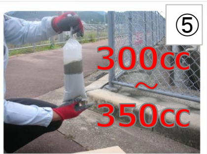
⑤ 計量した水を入れたらすぐに③の作業をします。