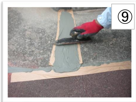
⑨ 塗り広げると凸凹なく仕上がります。