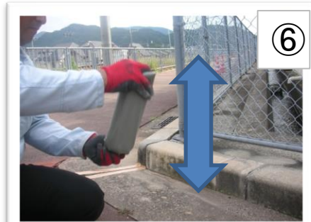
⑥ ④と同じく上下逆さまに持ち、勢いよく上下に20回ほど振り混ぜます。