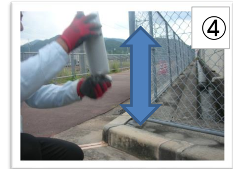
④ 袋を上下逆さまにし、軽く2〜3回上下に振りほぐします。