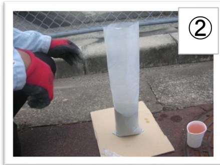
② 袋上部を切り取ります。