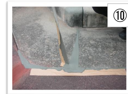
⑩ ガムテープをはがします。 半硬化状態のとき軍手などで表面をこすりますと、きれいになじみます。