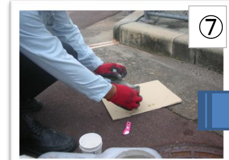
⑦ 下端部を切り取ります。※右図参照