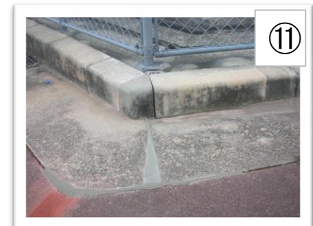
⑪ 完成。 硬化目安：夏期で30分〜、冬期で60分〜 可使目安：夏期で5分、冬期で15分